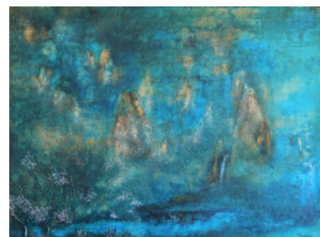
Le dénouement : la douceur Acrylique et technique mixte sur toile 60 cm x 81 cm - 2018