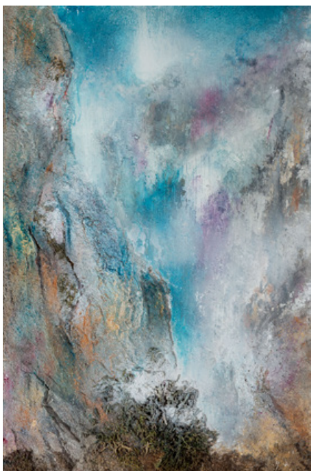
Clarté - Acrylique et technique mixte sur bois - 80 cm x 64 cm - 2018

Les montagnes sont une force symbolique. Ainsi, le tableau est un organisme vivant que je fais réagir.