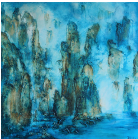
Se recentrer - Acrylique et technique mixte sur toile - 80 cm x 80 cm - 2018

Ainsi l'histoire de ma série « La quête de la source aux fleurs de pêcher » constitue un corpus d'œuvres où les formes sont les mots, les couleurs forment les rimes, une poésie visuelle reliée par les émotions. Métaphoriquement, la «Source aux fleurs de pêcher» est ce symbole d'un endroit inattendu, d'un monde préservé, îlot de sérénité, habituellement une nature sauvage d'une grande beauté ou une retraite du monde réel, une utopie.