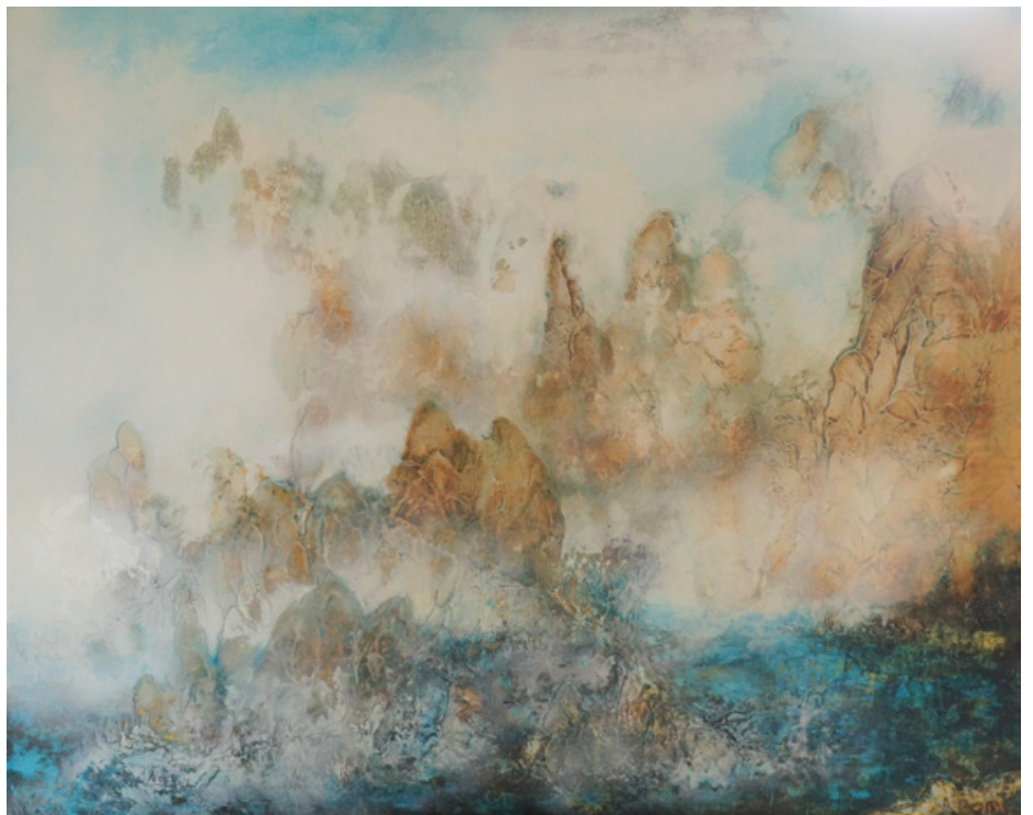
La Genèse - Acrylique et technique mixte sur toile - 65 cm x 80 cm - 2018

Comme Claude Monet à Giverny avant lui, Dominique Meunier possède son propre jardin aquatique. Dans l'idéalisme d'une nature chinoise réinventée et le zen des jardins japonais flottent les nymphéas et avec eux, une impression d'absolu retrouvé.