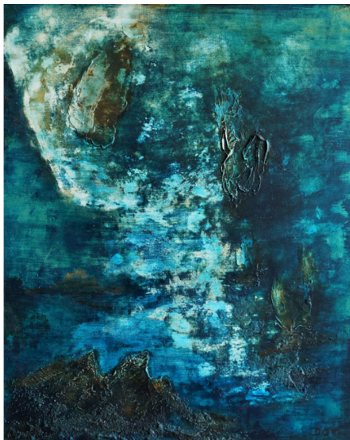
La passe sans porte - Acrylique et technique mixte sur toile 61 cm x 50 cm - 2018