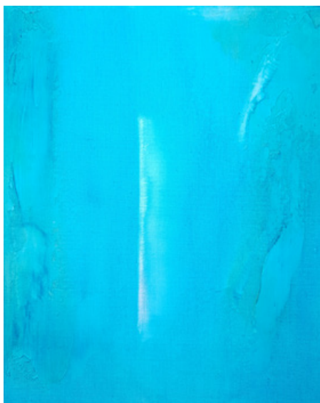
Irradiance - Acrylique et technique mixte sur toile - 41 cm x 33 cm - 2019

Ma peinture cherche à traduire, au travers de la lumière, les modes et les portes de passage entre les mondes intérieurs et extérieurs, les états de conscience modifiée, les réminiscences, un interstice dans lequel une quête cathartique débute. Ma peinture est «entre-deux», l'intervalle dans l'espace ou dans le temps. Il suppose une situation, une ambiance et une certaine dynamique commune. Ma série «L'autre rive», traduit l'intervalle en termes d'espace, cela signifie donc un intervalle entre deux choses qui sont en corrélation (comme par exemple entre deux nuages ou entre deux rochers, entre deux arbres).