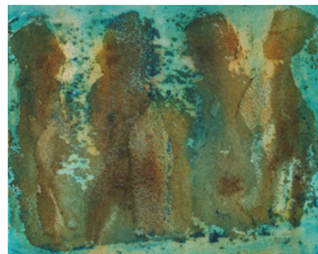
Les immortels - Acrylique et technique mixte sur toile - 38 cm x 46 cm - 2019