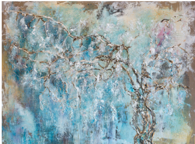
Liberté - Acrylique et technique mixte sur toile - 97 cm x 130 cm - 2019