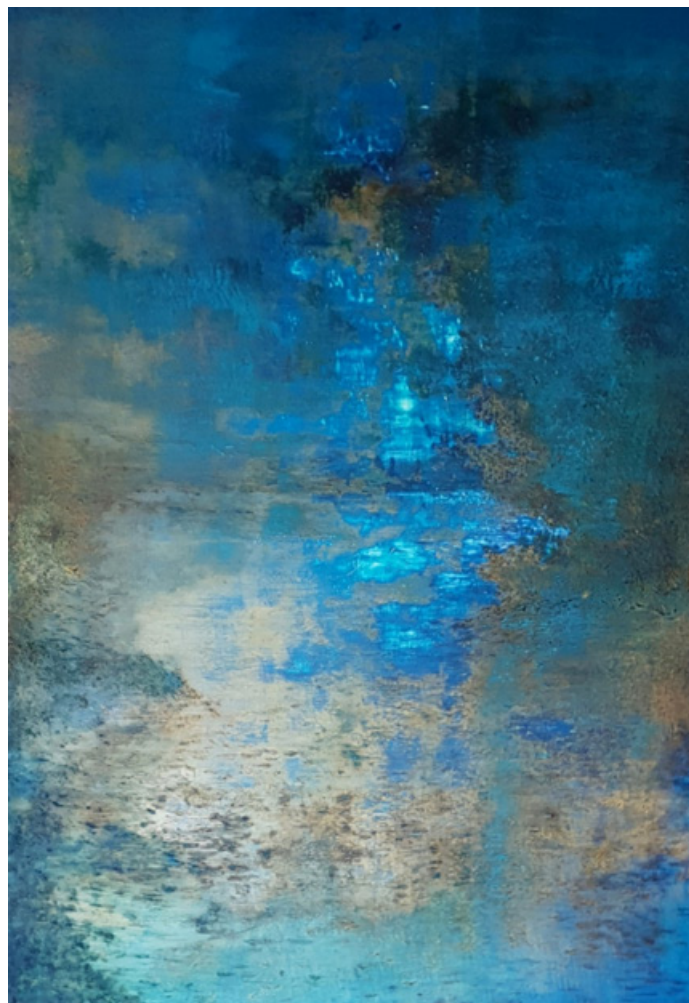
Chemin de lumière - Acrylique et technique mixte sur toile 92 cm x 65 cm - 2018

L'être humain est très peu présent dans les créations de l'Artiste dont la conception taoïste du monde fait de l'humanité une présence invisible dans la nature même. Le choix des couleurs lui permet d'exprimer la profondeur des paysages et de révéler cette dimension invisible, libérant le souffle-énergie. Ce travail des souffles chromatiques s'accompagne d'une attention particulière portée à la lumière qui baigne les œuvres de Dominique Meunier, devenant peu à peu prépondérante. En donnant vie à la matière, l'Artiste révèle toutes les aspérités de l'âme humaine.