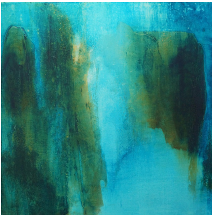
Onde - Acrylique et technique mixte sur toile 50 cm x 50 cm – 2019

Dans ma série Qinglü, la substance des objets se dissout peu à peu dans la lumière au sein d'une ambiance bleu-vert. Une confrontation matière-lumière naît.