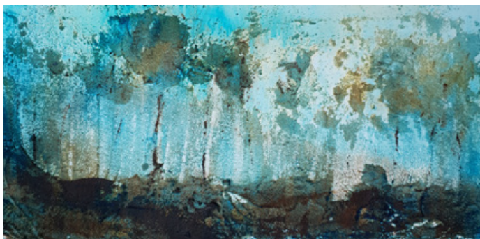
L'odeur de l'humus - Acrylique et technique mixte sur toile 40 cm x 80 cm - 2019