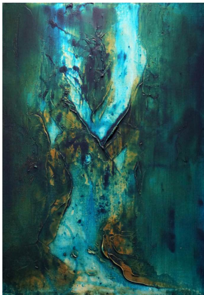
Transparence - Acrylique et technique mixte sur toile 70 cm x 50 cm - 2019