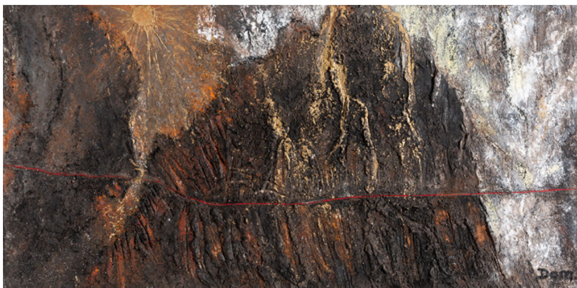
Mon chemin - Acrylique et technique mixte sur bois - 60 cm x 120 cm - 2016

Voici arrivé le temps du chant, et des louanges. Peintre passeur d'étoiles dans l'espace sans fin des bruissements de silence, Dominique MEUNIER reprend son chemin, dire l'absolu de la beauté, sa voix de vivante lumière.