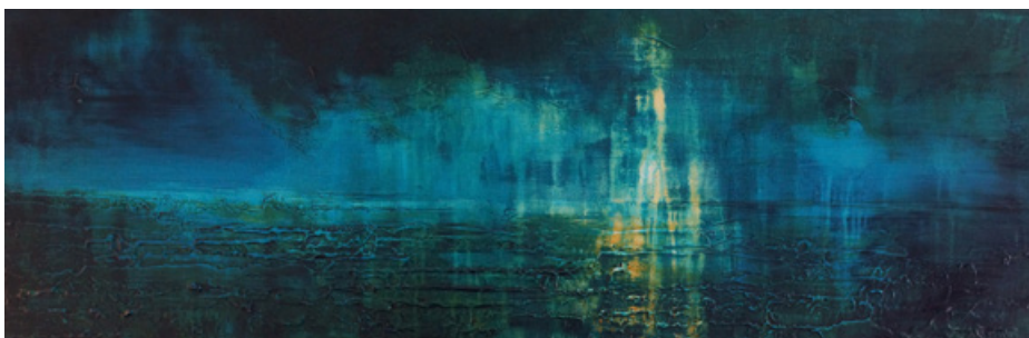
Reflets - Acrylique et technique mixte sur toile - 40 cm x 120 cm - 2018