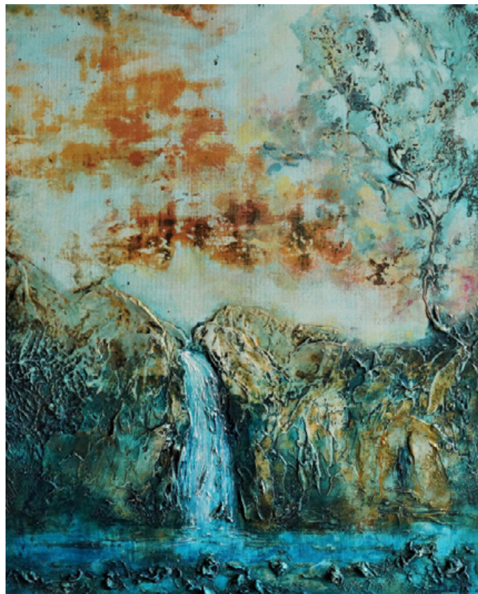
L'ermite à la source - Acrylique et technique mixte sur toile 61 cm x 50 cm - 2018