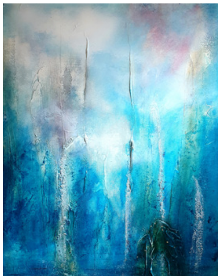
Prisme - Acrylique et technique mixte sur toile - 81 cm x 65 cm - 2019