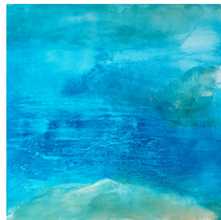
Limpidité - Acrylique et technique mixte sur toile - 80 cm x 80 cm - 2018