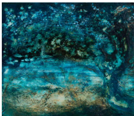
Je m'en retourne à Shangri-la Acrylique et technique mixte sur toile 60 cm x 70 cm - 2018