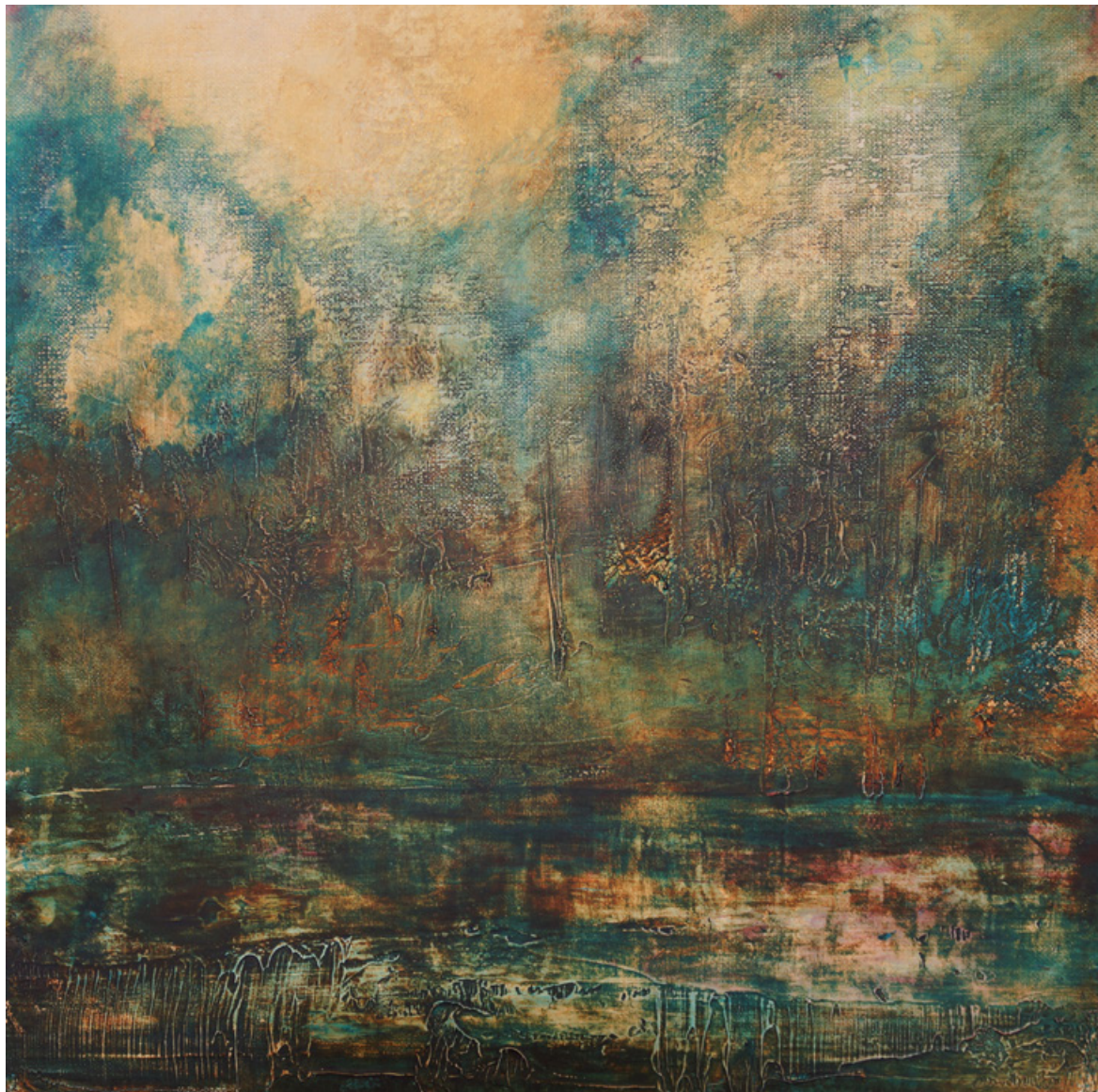
Chants d'automne - Acrylique et technique mixte sur toile - 50 cm x 50 cm - 2018

Cette œuvre traduit en couleurs et matières une mélodie d'automne. Réalisée en écoutant Antonio Vivaldi, elle est comme une lumière de fin d'automne avec ses reflets ors et roux, son bleu si rare et si caractéristique, et l'endormissement des terres et des eaux en repos. Seule l'âme s'épanche. La substance des objets perd progressivement sa matérialité en s'évanouissant dans la lumière jusqu'à l'éblouissement telle une dissolution sereine.