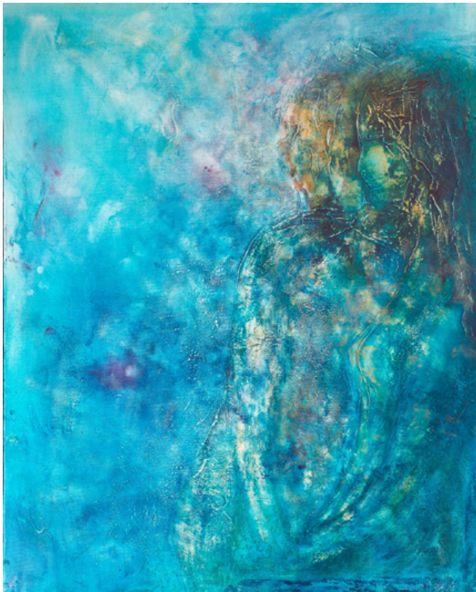
Eternité - Acrylique et technique mixte sur toile 92 cm x 73 cm - 2018

Ma série «Présence» traduit l'intervalle en termes de temps, cela signifie une pause entre des faits qui se suivent, un interstice entre le passé et futur, la présence d'un instant d'Eternité. Il est question de rythme, d'impermanence, comme entre deux notes de musique ou entre deux couleurs qui construisent la mélodie : « un ton seul n'est qu'une couleur, deux tons c'est un accord, c'est la vie » soulignait Matisse.