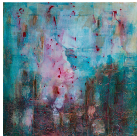
Sortilège - Acrylique et technique mixte sur toile - 70 cm x 70 cm - 2018