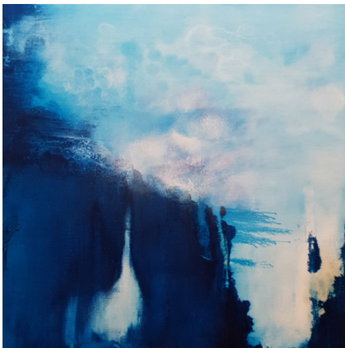
Hymne - Acrylique et technique mixte sur toile 70 cm x 70 cm - 2019