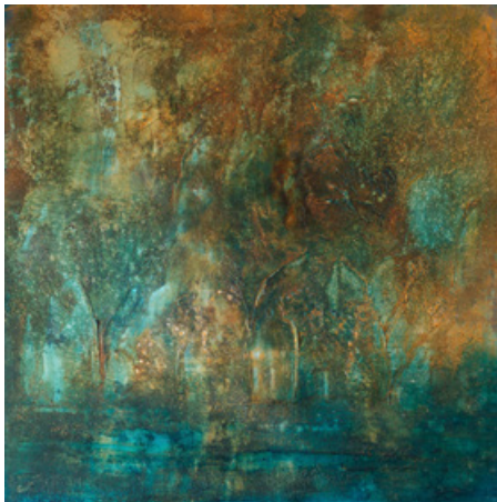
Renaissance - Acrylique et technique mixte sur toile - 70 cm x 70 cm - 2019

Cette dernière instaure un dialogue entre couleurs et transparence, fluidité et mouvements, matière et opacité et permet de raconter une histoire en transfigurant le réel par le jeu des vibrations de lumière qui dynamisent les tensions spatiales.